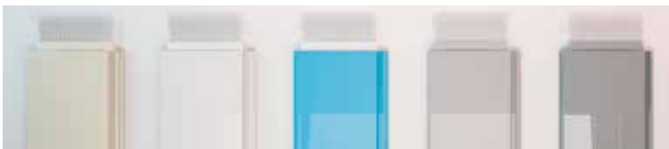
Lames PVC 75 mm avec option brosses : beige, blanc, bleu opaque, gris perle et gris soutenu.