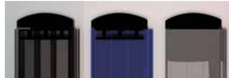
Lames Polycarbonate 70 mm avec bouchons : gris / noir, bleu / noir, gris métallisé / noir