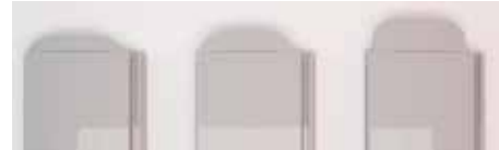
Les ailettes existent en 3 profondeurs* : 10 mm, 20 mm, 30 mm.

* Montage usine 20 mm, autres dimensions en SAV.