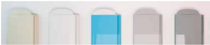
Lames PVC 75 mm avec ailettes de 20 mm : beige, blanc, bleu opaque, gris perle et gris soutenu.